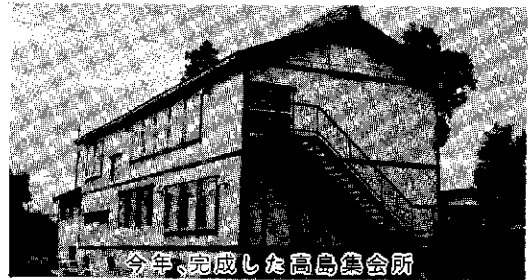
今年、完成した高島集会所