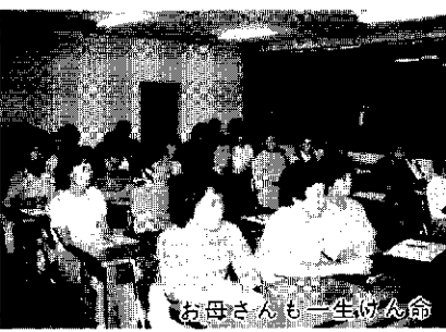
お母さんも一生懸命

長い老後を生きるためには、若いうちから学ばず習慣をつけておく必要があるといわれています。あなたもぜひ公民館の成人講座へ。 ● 開級式 4月15日(火) 夜7時～9時 ● 期間 4月～12月 ● 入講料 800円