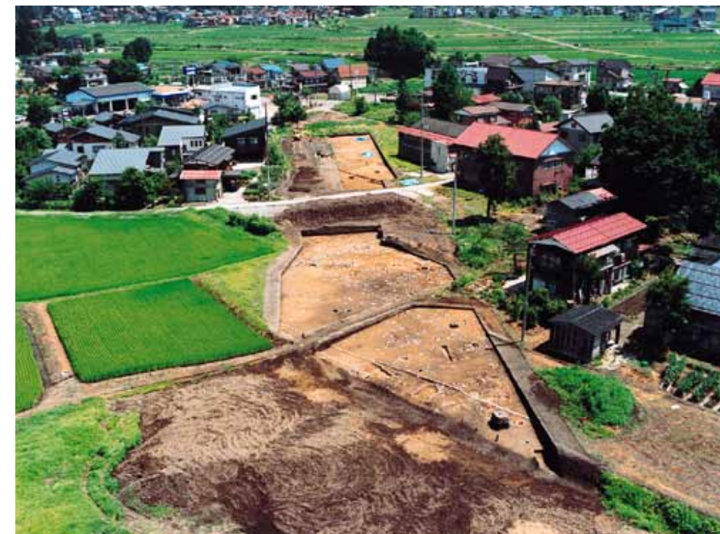
道下南遺跡・発見された遺構（ラジコンヘリで撮影）

道下南遺跡 道下南遺跡（太子堂）は、国道117号の西約100mの所に位置します。標高は130mです。