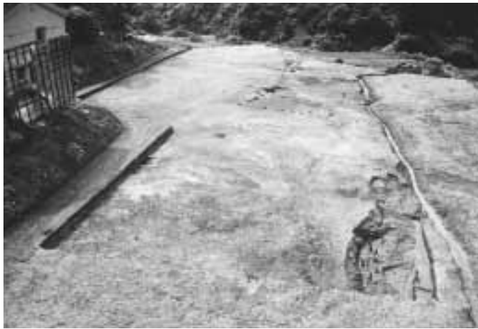
道端A遺跡・発見された遺構

県営中山間地域総合整備事業に伴い、5月中旬から8月下旬の間に、隣接するB遺跡と合わせて、約1,800㎡の範囲を発掘調査しました。その結果、縄文時代と近世（江戸時代）の遺跡であることが明らかになりました。出土した遺物は、縄文土器、