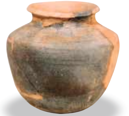
馬場上遺跡出土の壺