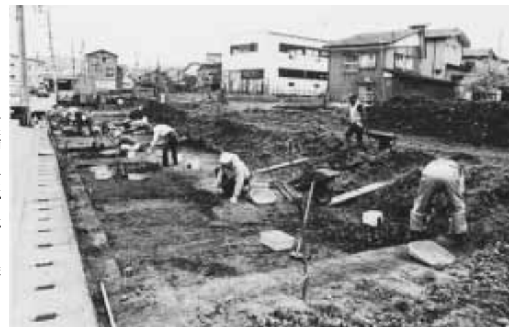
馬場上遺跡・調査のようす

15枚です。銭貨が発見された付近からは、人骨片が多く出土していることから、これらは六文銭（三途の川の渡し銭）として墓に副葬されたものと思われるものと推定されています。