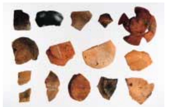
発見された土師質土器

市道高山太子堂線の建設事業に伴い、4月下旬から9月中旬の間に、約2,000㎡の範囲を発掘調査しました。出土した遺物は、縄文土器や打製石斧、石鏃などの石器類のほか、中世の陶磁器類、銭貨などです。陶磁器には、珠洲焼、土師質土器などがあります。