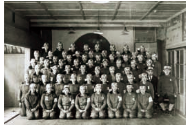
女学生の勤労働員（昭和20年）

昭和六年九月に勃発した満州事変は、翌年一月には上海事変に飛び火し、一二年には日中戦争へと戦火が拡大していきまし