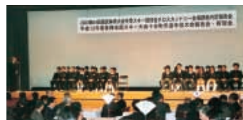
各種スキー競技会で活躍した選手団

3月13日(火)、(財)新潟県スキー連盟は、第64回国民体育大会冬季大会クロスカントリースキー競技の開催地を十日町市に決定しました。これを受けて、3月25日(日)、2009年第64回国民体育大会冬季スキー競技会クロスカントリースキー会場誘致内定報告会並びに平成12年度各種全国スキー大会十日町市選手団大会報告会・祝賀会がクロス10で行われ、スキー関係者など150人が出席しました。