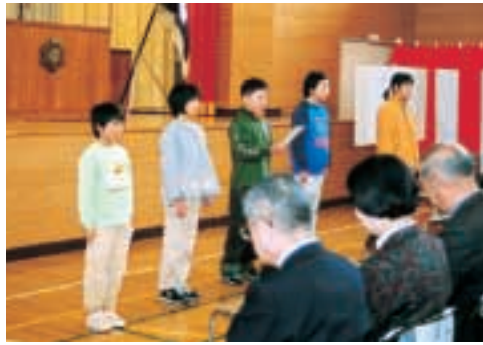
思い出をリレーで語る児童

昭和32年には72人いた児童が年々減少し、平成12年度は5人になってしまいました。少子化が進む中、極小規模校として、