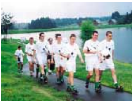
当間高原で調整するアイルランド18歳以下代表

アイルランドチームに キャンプ地をPR 第5回国際ユースサッカーIN新潟に参加したアイルランドと韓国ソウル市の18歳以下の代表チームが、7月12日(木)から3日間、キャンプ候補地の当間高原リゾートホテルベルナティオに滞在しました。 誘致実行委員会は、A代表チームのW杯本大会出場が有力なアイルランド関係者に対して誘致活動を展開しました。また、ホテル側にとっても選手受け入れの絶好のリハーサルとなりました。