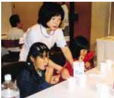
ブラッシング指導