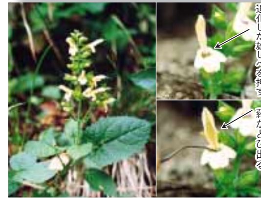
退化した雄しべを押す 薬がとび出る

発行/十日町市役所 〒948-8501 新潟県十日町市千歳町3丁目3番地 TEL0257-57-3111 FAX52-4635 Email info@city.tokamachinigata.jp URL http://www.city.tokamachinigata.jp 編集/企画人 課 広報係