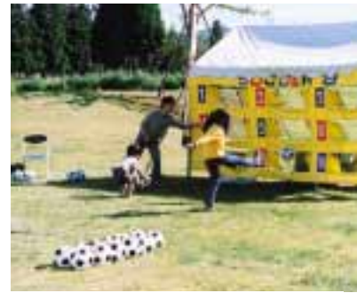
▲サッカーも大人気