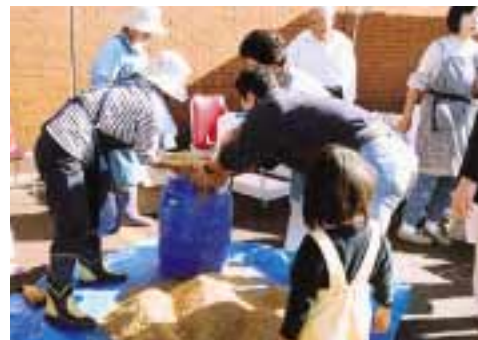
環境NPOによるEMぼかしの実演