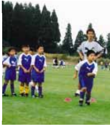
▶柏レイソルサッカースクール