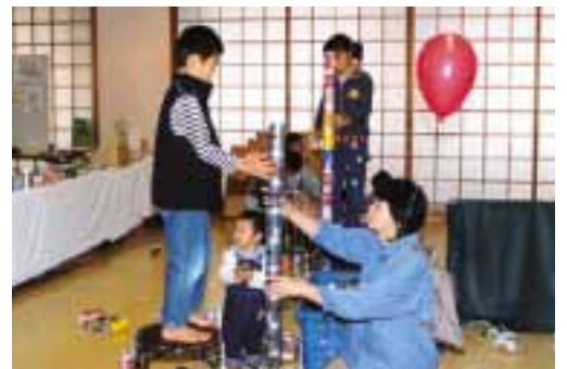
21段の記録もでた自由参加の空き缶積み大会