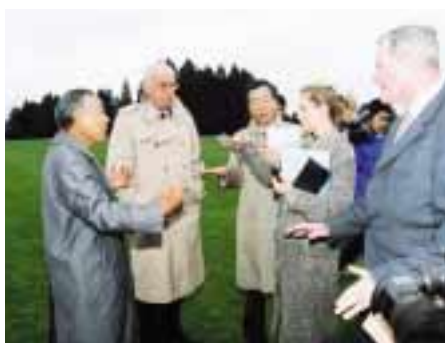
視察に訪れたクロアチア関係者

抽選という運命のいたずらによつてスペイン・ポーランドのキャンプ誘致は幻に消えました。1次リーグを日本で戦う場合という条件で、両国から仮予約を得ていた本市にとつて、結果はあまりにも残念なものとなりました。12月1日(土)には、招致イベントが十日町情報館で行われ、市民150人がスクリーンを前に、釜山での抽選の様々を見守っていました。ところが、抽選の冒頭でスペインの可能性が消え、ポーランドは欧州最後の1枠で韓国のグループに入るという最悪の結末。その瞬間、会場は「なぜだ」という悲痛な声とため息に包まれました。