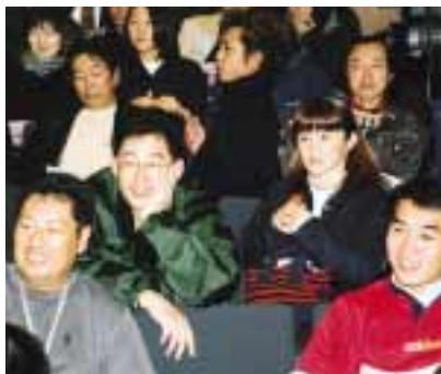
最悪の抽選結果に呆然とする人々

抽選という運命のいたずらによつてスペイン・ポーランドのキャンプ誘致は幻に消えました。1次リーグを日本で戦う場合という条件で、両国から仮予約を得ていた本市にとつて、結果はあまりにも残念なものとなりました。12月1日(土)には、招致イベントが十日町情報館で行われ、市民150人がスクリーンを前に、釜山での抽選の様々を見守っていました。ところが、抽選の冒頭でスペインの可能性が消え、ポーランドは欧州最後の1枠で韓国のグループに入るという最悪の結末。その瞬間、会場は「なぜだ」という悲痛な声とため息に包まれました。