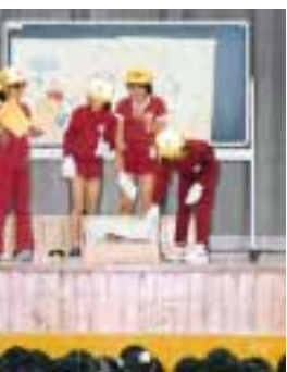
分別方法を元気に発表

リサイクルの学習の中で、わたしたちは、ペットボトルのリサイクル工場に見学に行きました。ペットボトルやトレーなどが山のように積まれていました。それは、一日分の量だと聞いてびっくりしました。それから、そのごみを分別してみました。