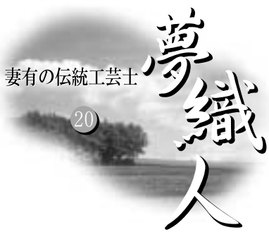
妻有の伝統工芸士

「お世話になりました」「ありがとうございます」などの何気ない患者さんの言葉が、とてもうれしいです。役に立っているんだなと励みになります。毎日が違って、機械的じゃなく、いろいろ考えさせられるけど、楽しくて本当にやりがいがある仕事です。