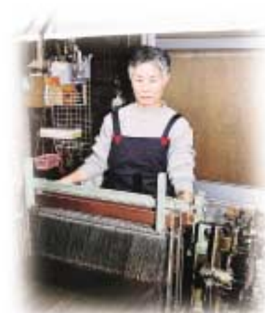
昭和14年生まれの64歳。30年に機屋に勤め、織りを始める。出機に替えた現在も細織を織り続ける。平成5年度、十日町機織部門の伝統工芸士に認定される。

子どもが小・中学生のころ、外にパートに出るため数年間、機を離れました。でも、子どもが成長したら、好きな機織りに戻りました。今は月に数反ほど、自分のペースで織っています。柄が細かいものは苦勞しますが、耕がうまくできあがったときの喜びは大きいです。いつも買う人の気持ちにな