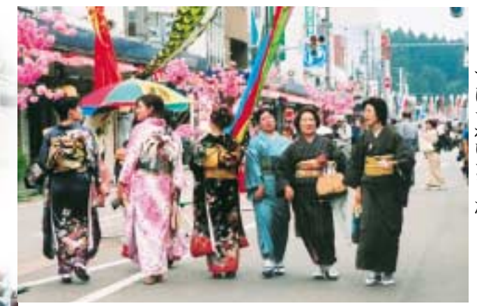
振袖から紬絹まで、さまざまなきものを着た多くの人にぎわいました