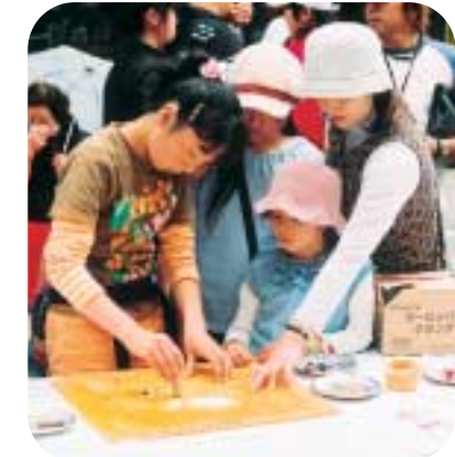
摺り友禅や絞り染めなどが実際にできた染織体験広場