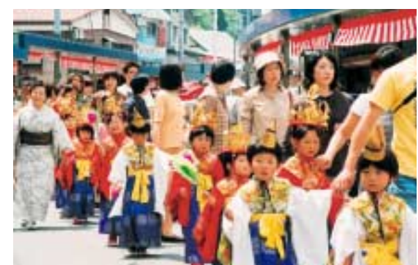
かわいらしく着飾った子どもたちが本町通りを練り歩いた花まつり稚児行列