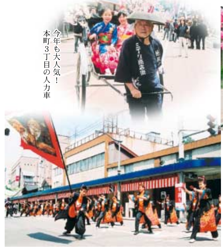
今年も大人気！本町3丁目の人力車