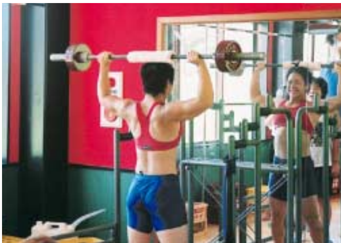
▼屋内でのウエイトトレーニング