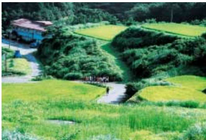
道場周辺の坂道をランニング

アテネ五輪女子レスリング日本代表4選手 伊調千春（48kg級）吉田沙保里（55kg級） 伊調馨（63kg級）浜口京子（72kg級）