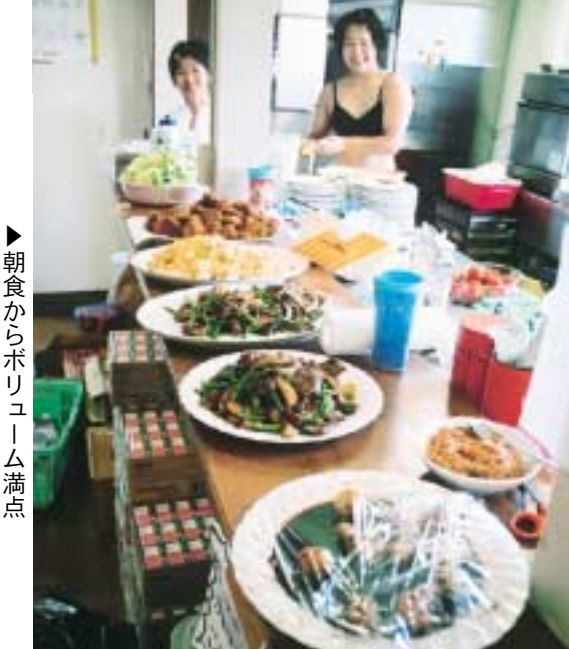
▶朝食からボリューム満点