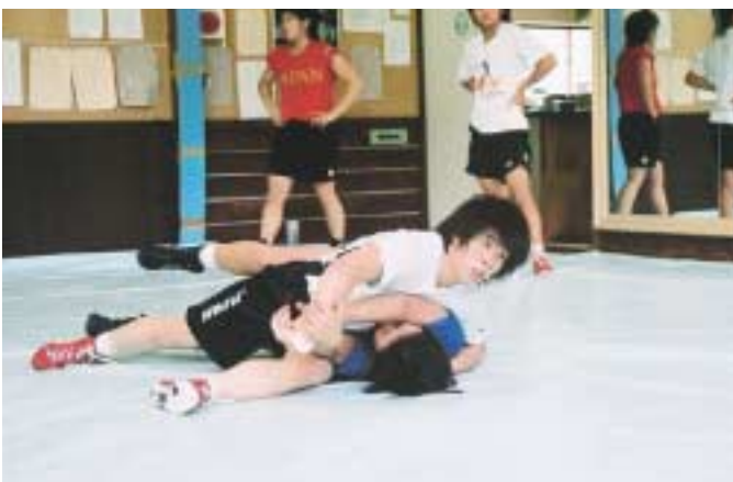
▲午後からは実戦を想定したスパーリング