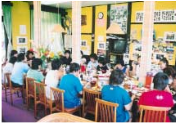
全員そろって食堂で食事