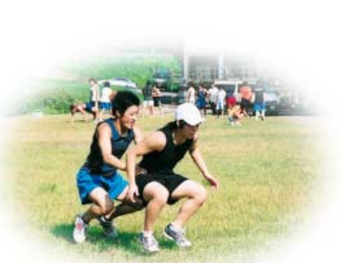
▲グラウンドでのサーキットトレーニング

午後の練習はマット上でのスパーリングなどハードなトレーニングの連続で、6時過ぎまで続きました。その後、夕食をとり、就寝。選手たちの1日が終了しました。