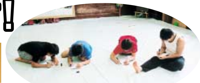
思いを込めてメッセージを書き込む4選手